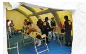
医療救護班と連携した医療活動訓練