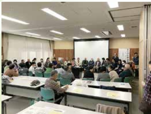
アイスブレイクとしてゲームをやっているところです

人とつながることや地域の身近な居場所の必要性についてお話を伺うことができました。