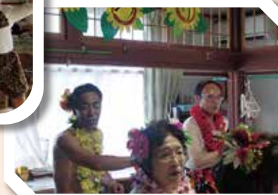
フラダンスですが・・・