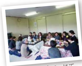
②こまどりカフェにて

どなたでも、気軽に立ち寄っていただき、 お茶を飲みながらおしゃべりしたり、 とにかく楽しく、ほっとする、 くつろぎの場所です。 お気軽に参加してください。