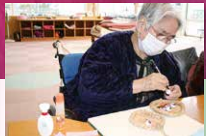
自分のおひな様づくりに取り組みました。風情のあるお顔でかわいいおひな様に仕上がりました。 もう、春ですね……。 (ふれあいデイサービス)