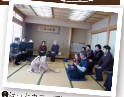
①ほっとカフェでは、今回はお茶を点ててくださる方がおり、抹茶をいただきました。