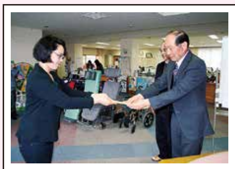
平成28年熊本地震被災者支援の会様

募集期間は平成29年3月31日までとなります。引き続き町内各施設等の義援金箱へご協力をお願いします。