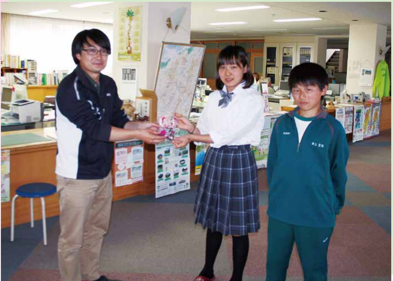
佐久穂中学校生徒さんから真心の義援金が寄せられました

発行：社会福祉法人 佐久穂町社会福祉協議会 ☎0267-86-4273 印刷：キクハラインク有限会社