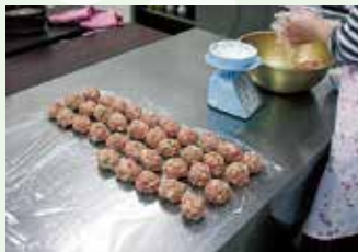
一ヶずつ計量します (写真は60人分です)