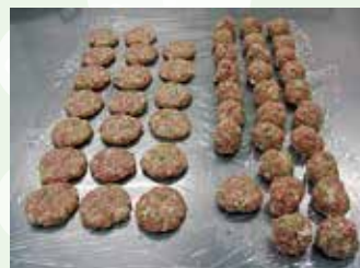
心のこもった手作りで 提供しています