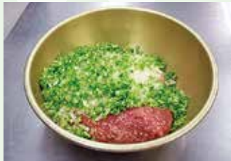
ベテランスタッフによる みじん切りした春キャベツ がたっぷり入っています

平成27年4月より「ふれあいデイサービスの昼食」が新たにはじまりました。 キャベツ入りメンチカツ、こんな風に作っています。