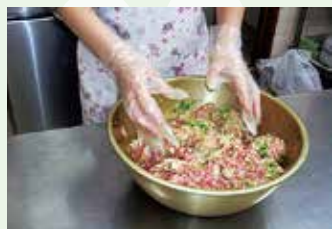
キャベツとひき肉を ほどよく混ぜ合わせます